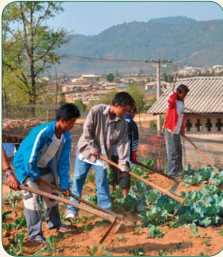
Ehemalige Kindersoldaten in einer unserer Einrichtungen. In diesen finden oft auch ihre Geschwister Platz. Hier bekommen sie zu Essen, Ausbildung und ein soziales Umfeld.

Momentan sehen wir nur eine Chance des Eingreifens: Seit einigen Monaten unterstützt Silaoh Projekte einer Partnerorganisation in Burma, deren Namen wir Ihnen auf persönliche Nachfrage gerne nennen, aus Sicherheitsgründen aber an dieser Stelle darauf verzichten. In den von uns unterstützten Einrichtungen werden ehemalige Kindersoldaten aufgefangen und erhalten Essen, Hygiene und ein sicheres Umfeld. Unsere Mitarbeiter betreuen sie überdies psychologisch und bereiten sie mittels Schule und Ausbildung optimal auf ihren weiteren Lebensweg vor.