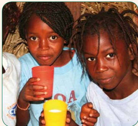
Alle Schüler von Siloah erhalten in der Schule eine Mahlzeit: Mit vollem Magen lernt sich's einfach besser.

Auch warum die Ausgabe von Milchbrei durch die Ausgabe von grossen Seifenriegeln ergänzt wird, ist schnell erklärt. „Wir halten die Schüler dazu an, sich vor dem Essen die Hände zu waschen, wozu sie die Seife nutzen“, wie Glinka weiter berichtet. Die Kinder werden über die grosse Bedeutung von Hygiene und Sauberkeit aufgeklärt. Das Wissen und die Seife nehmen sie mit nach Hause.