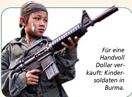
Für eine Handvoll Dollar verkauft: Kindersoldaten in Burma.

Es braucht diese Informationen, um die Situation in Burma zu verstehen und ein Problem zu erfassen, dessen Dramatik und Tragweite im Westen gerne verschwiegen wird: Sowohl den Rebellenarmeen als auch den offiziellen Truppen der Machthaber fehlt es an freiwilligen Rekruten. Und sie haben eine Lösung gefunden, die mit „perfide“ nur unzureichend beschrieben ist.