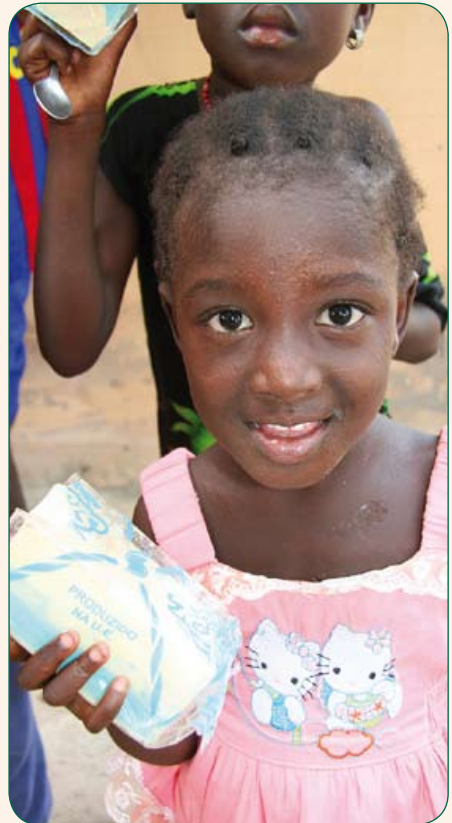
Ein Stück Seife genügt für mehrere Wochen: Hygiene und wirksamer Gesundheitsschutz für das Kind und seine ganze Familie.

ihre Kinder bei der Feldarbeit ein“, so Glinka. „Das ist verständlich, denn jede zusätzliche Hand kann die Ernte steigern und helfen, die Familie satt zu machen. Die SonderSpeisung bewirkt ein Umdenken: Die Eltern erkennen den Wert von Bildung und Ausbildung und schicken ihre Kinder zur Schule.“ Milch respektive Milchbrei verbessert da-